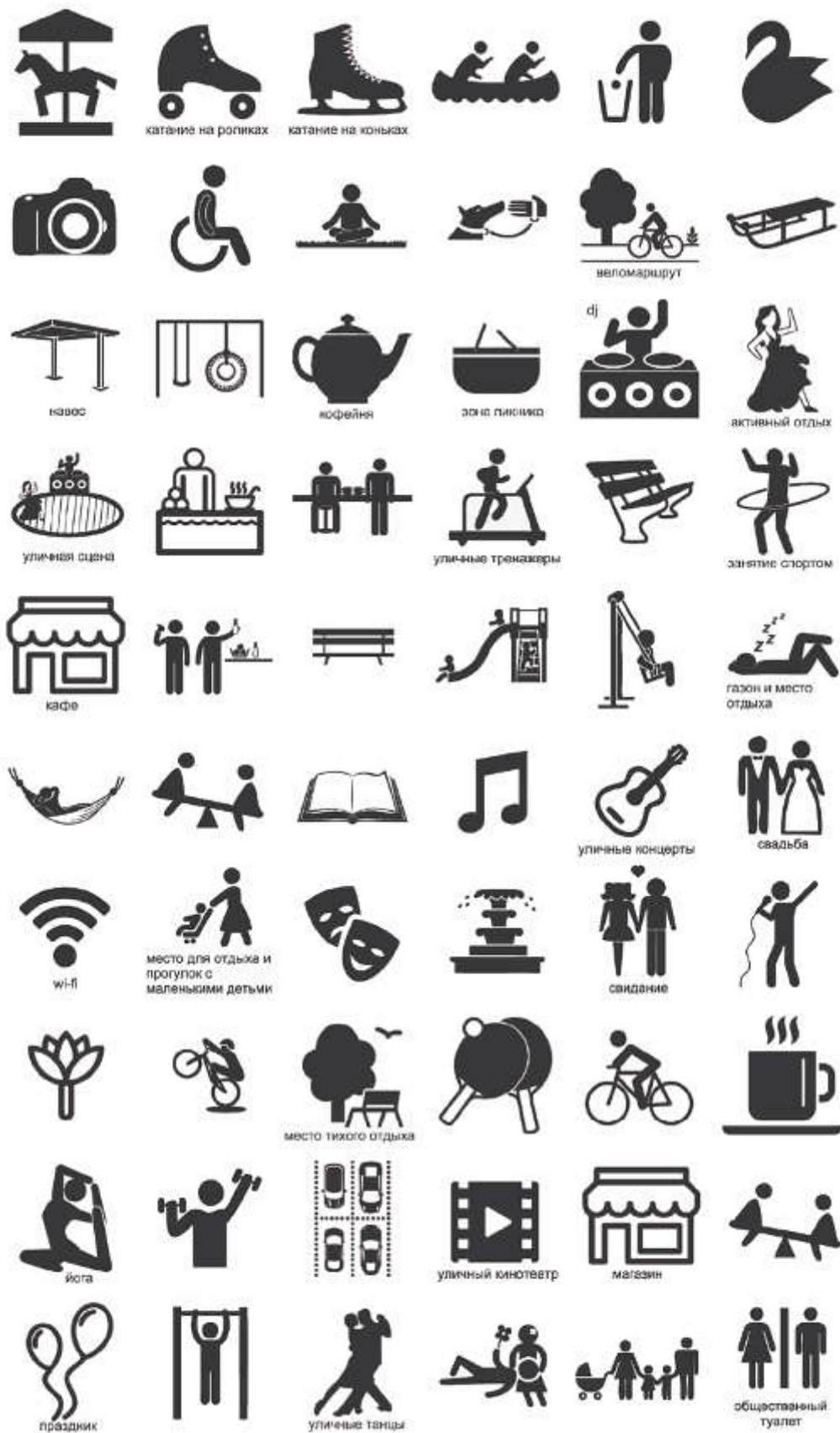
Пример набора значков для проведения дизайн-игры, используемых для работы с картой